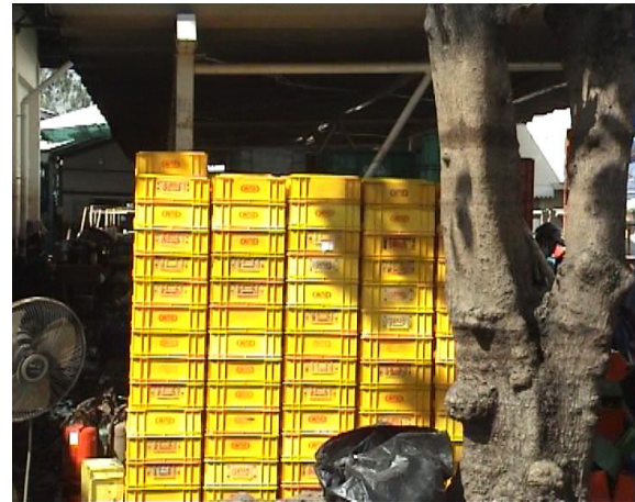
ทำความสะอาดกล่องใส่ชิ้นงาน