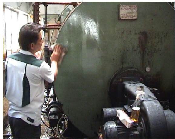
ทำความสะอาดเครื่องจักร