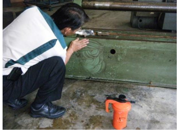
2. ฉีดพ่นทำความสะอาดด้วยอุปกรณ์ทำความสะอาด