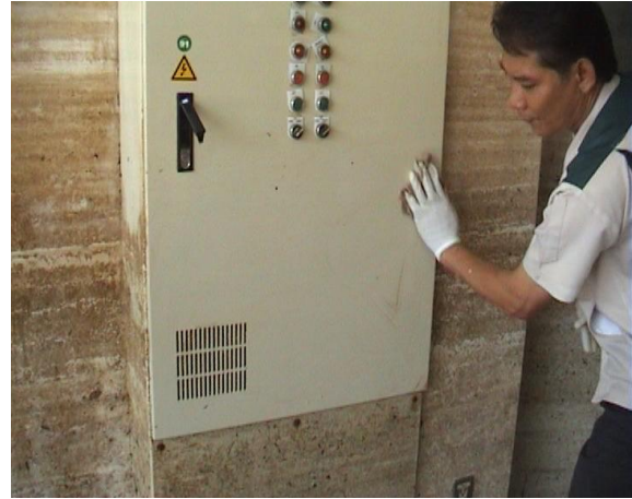
ทำความสะอาดตู้คอนโทรล (ภายนอก)