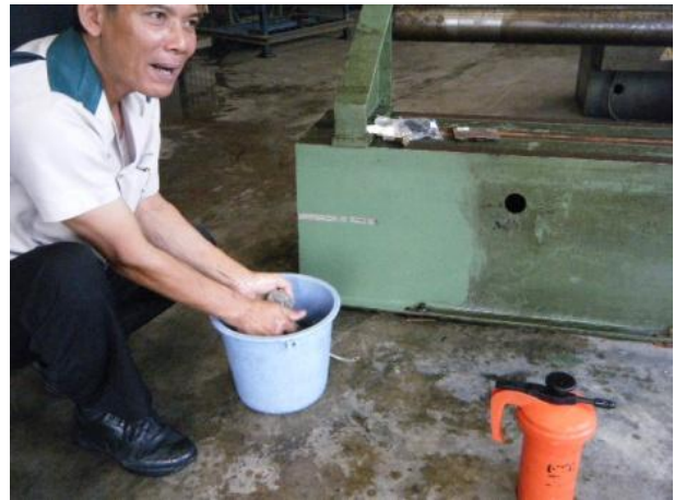
4. เปรียบเทียบบริเวณที่ทำความสะอาด