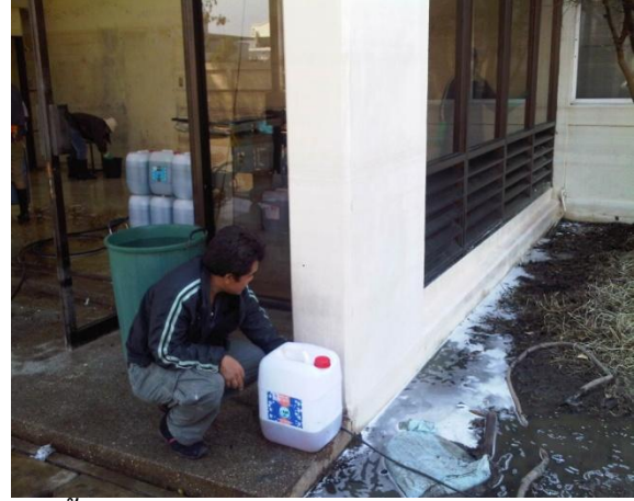
ทำความสะอาดผนังและพื้นภายนอก