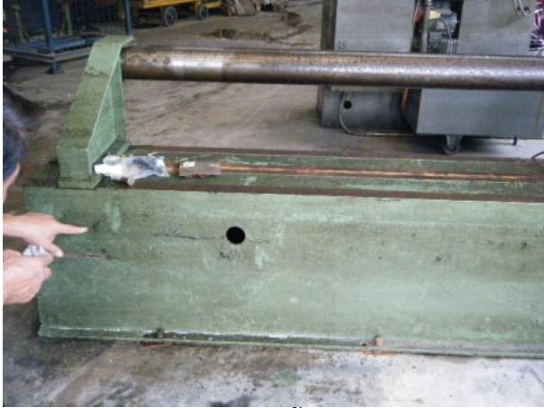
1. ฉีดพ่นผลิตภัณฑ์ทิ้งไว้ 10-20 นาที