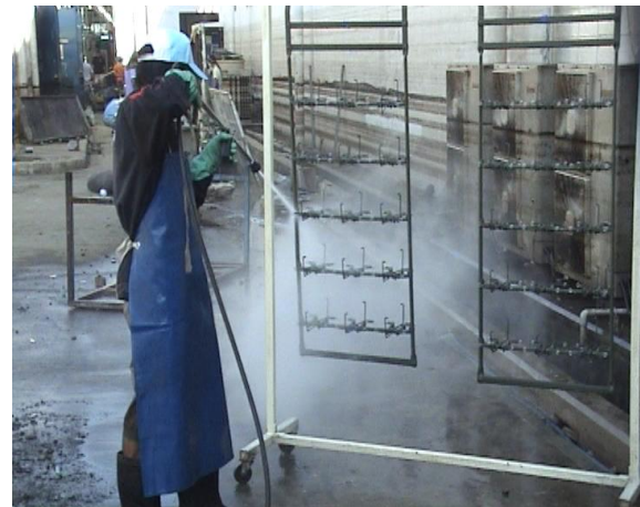
ทำความสะอาดแรคแขวนชิ้นงาน