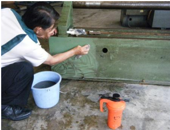
3. ใช้ผ้าชุบน้ำหมาดๆ เช็ดคราบสกปรกออก